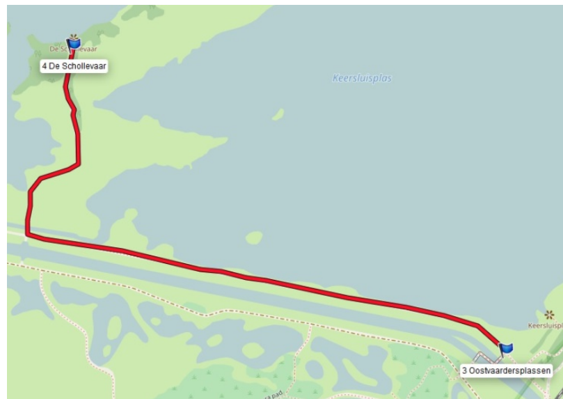
Variant 1 januari tot 1 mei